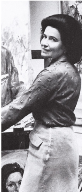
BETTINA BÖHMER, ARCHIV DER MAGDA BITTNER-SIMMET STIFTUNG

35 | SONNTAG, 26. MÄRZ, 14 UHR, NICHT BARRIEREFREI